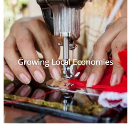
Growing Local Economies

Daha fazla ayrıntı için www.rotary.org sitesini ziyaret ediniz.