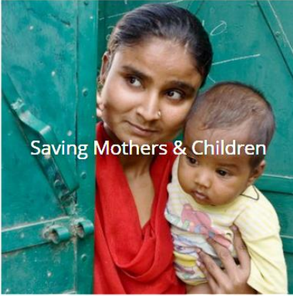
Saving Mothers & Children